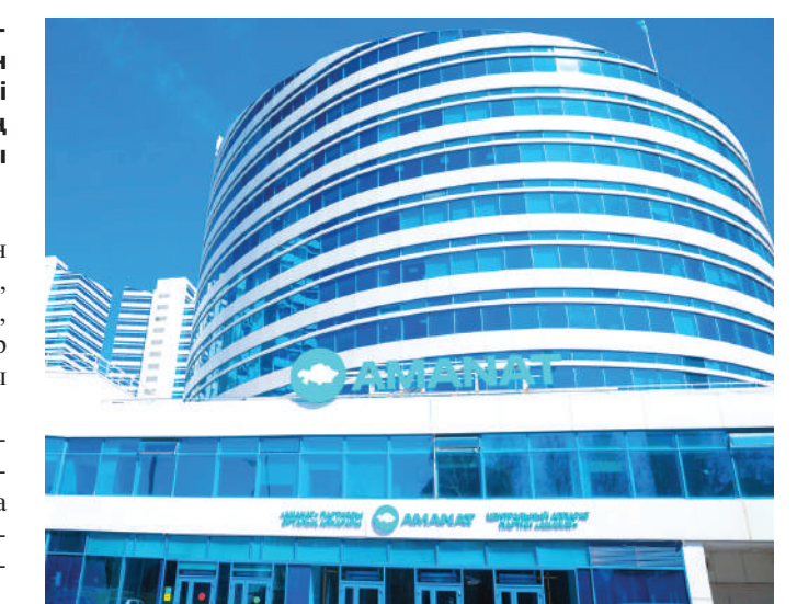
Дайындаған Нұрлан КОСАЙ

Форум барысында Мемлекет басшысы Қасым-Жомарт Тоқаевтың реформаларын жүзеге асыру аясында өңірлерді дамыту, сондай-ақ мәслихаттардың өкілеттіктерін кеңейту мәселелері талқыланады.